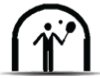
Kapalı Spor Salonlar