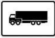
Tır ve Kamyon Yüklemeleri